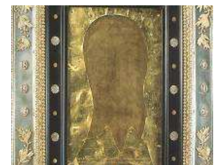
4. Kopie in Wien von 1616