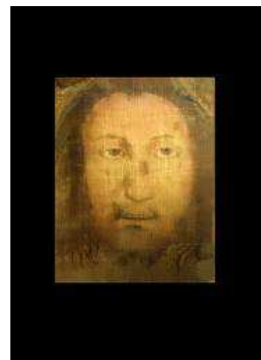
7. Volto Santo

Ein großes Geheimnis ist es noch, welches Schleiervuch sich im Jahre 1849 bei der dreitägigen Ausstellung im Petersdom (s. o.) über das Tuch im Veronikapfeiler legte, so dass « das göttliche Antlitz sehr deutlich erschien ». War es der Volto Santo ( Bild 7 ), der damals sicher in Manoppello war ? Hat dieser sich auf wunderbare Weise darüber gelegt ? Wenn ja, dann könnte das Bild für die Menschen im Petersdom damals etwa so ausgesehen haben, wie die Überlagerung ( Bild 8 ) zeigt. Wir wissen es nicht. Doch eines machen alle diese Bilder offenkundig, dass die « Vera Icon », der heutige Volto Santo von Manoppello, nicht im Veronikapfeiler ist und auch nie darin war.