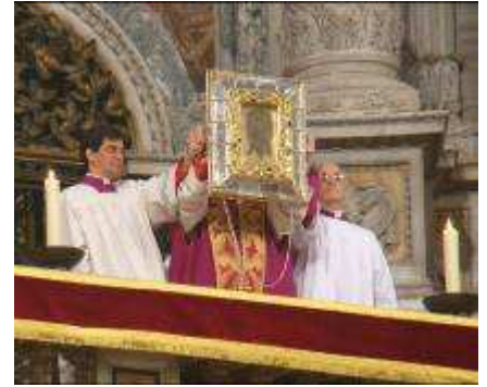
1. Veronika im Veronikapfeiler 2009