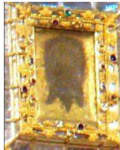
5. Veronika im Veronikapfeiler

Die Frage ist nur : Was ist das Original ? Diese Frage ließe sich nur beantworten, wenn man es untersuchen würde. Wenn es das originale Schweiß Tuch der Veronika am Kreuzweg wäre, müssten z. B. Blutspuren darauf sein. Und wenn die DNA dieser Butspuren die gleiche wäre, wie von denen auf dem Turiner Grabtuch, dann wäre dies ein besonderer Echtheitsbeweis für beide. Es ist wohl ein Gebot der Wahrheit, dieses Geheimnis des Bildes im Veronikapfeiler baldmöglichst zu lüften.