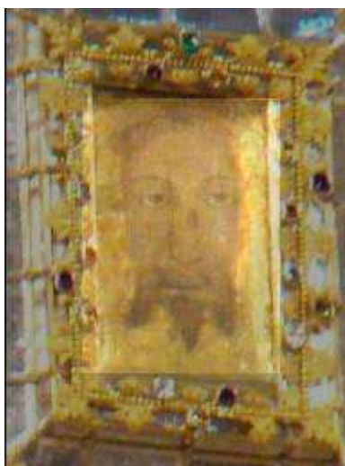
8. Überlagerung v. Bild 5+7)

Die Frage ist nur : Was ist das Original ? Diese Frage ließe sich nur beantworten, wenn man es untersuchen würde. Wenn es das originale Schweiß Tuch der Veronika am Kreuzweg wäre, müssten z. B. Blutspuren darauf sein. Und wenn die DNA dieser Butspuren die gleiche wäre, wie von denen auf dem Turiner Grabtuch, dann wäre dies ein besonderer Echtheitsbeweis für beide. Es ist wohl ein Gebot der Wahrheit, dieses Geheimnis des Bildes im Veronikapfeiler baldmöglichst zu lüften.