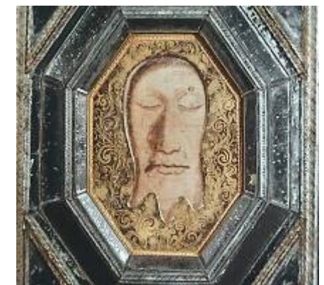
3. Kopie von Il Gesu (1616)