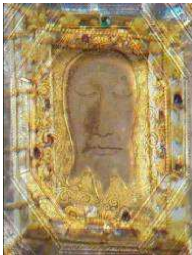
6. Überlagerung v. Bild 3+5

Vergleicht man nun die Kopie von Il Gesu aus dem Jahre 1616 ( Bild 3 ) mit dem ,das jedes Jahr am Passionssonntag gezeigt wird ( Bild 5 ), dann ergibt sich fast eine Deckungsgleichheit, wie folgende Überlagerung zeigt ( Bild 6 ). Es ist also augenscheinlich, dass die Kopie von Il Gesu fast ähnlich ist dem Bild im Veronikapfeiler. D. h. das Bild, das heute noch am Passionssonntag gezeigt wird, muss das gleiche sein wie jenes, das Papst Paul V. im Jahre 1616 kopieren ließ und von dem er der Königin Konstanze schreibt, dass es fast identisch sei mit dem Original.